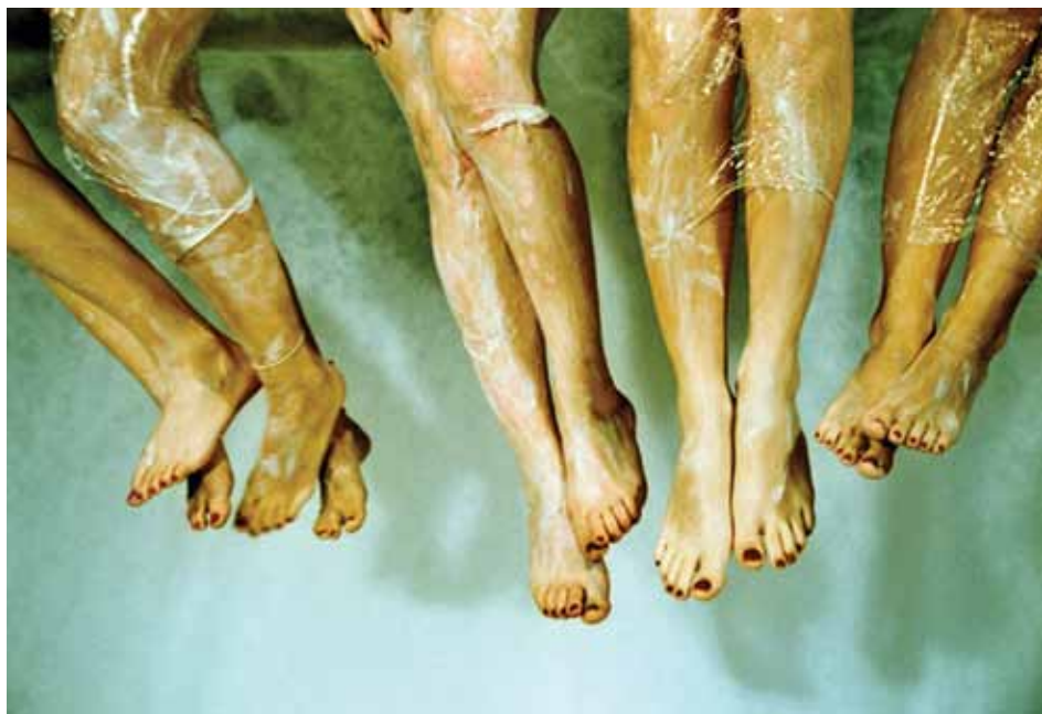
Agonía , 2005 Serie Putas Fotografía 60 x 90 cm

hersiliaalvarez@gmail.com www.hersiliaalvarez.com