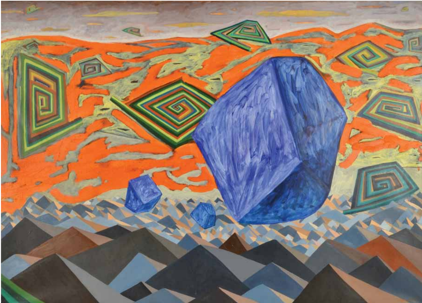
Soy la piedra azul , 2011 Acrílico sobre tela 180 x 250 cm