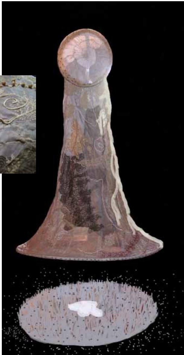
Bajo el manto de la luna , 2013 Instalación a partir de objeto textil, pasto sintético y pañuelo con semen. 2,10 mts. de altura, 2,00 mts. de diámetro de base aprox.