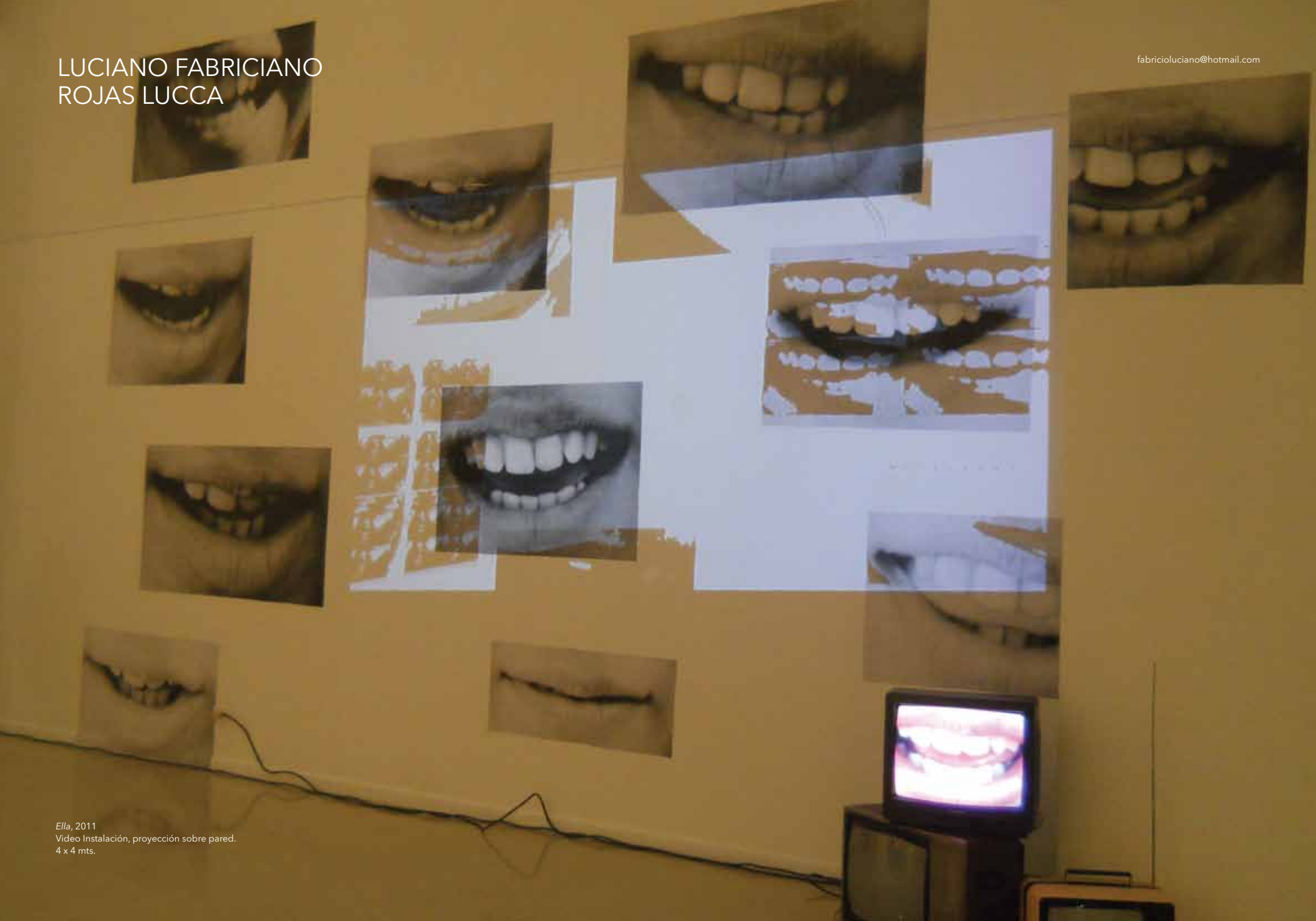
Ella , 2011 Video Instalación, proyección sobre pared. 4 x 4 mts.