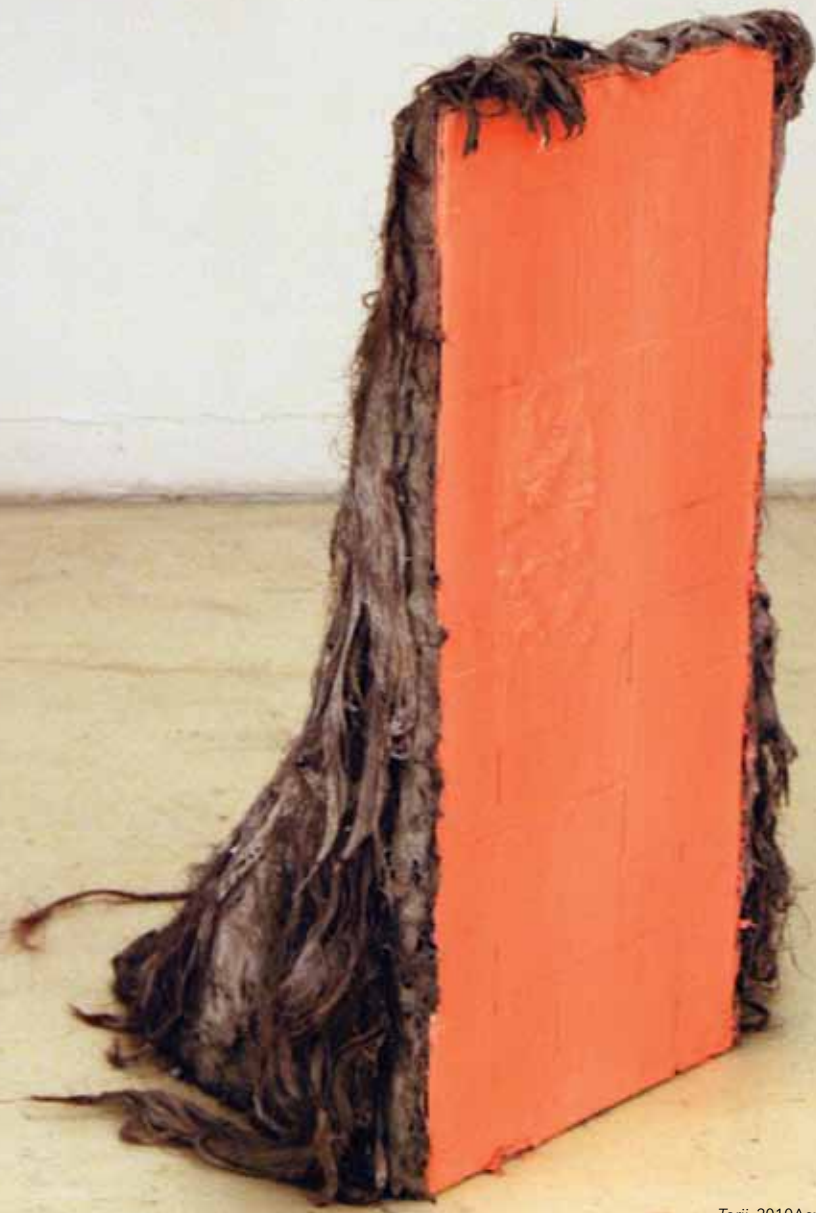
Torii , 2010 Acrílico sobre mosaicos y pelucas cementadas. 100 x 50 x 50 cm

ramirooller@gmail.com www.ramirooller.net